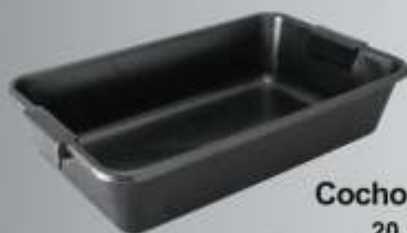
Cocho de Massa 20 Litros