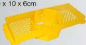
Suporte p/ Laje 30 x 10 x 6cm