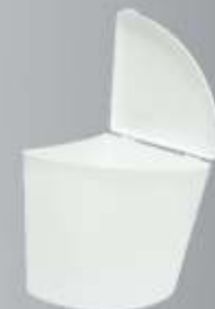
Lixeira de Canto 6 Litros