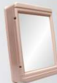
Armário 43 x 29 x 11cm