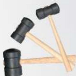
Martelo de Borracha P 40cm M 60cm G 80cm