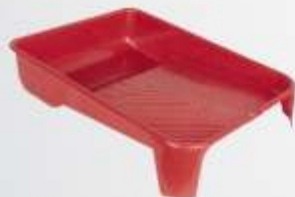
Bandeja de Pintura 16cm (26 x 20,5 x 6,5cm) 23cm (38,5 x 29 x 8cm)