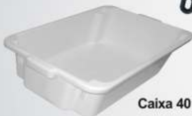
Caixa 40 Litros