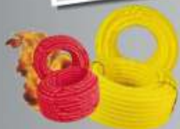
Eletroduto Corrugado ou Anti-Chamas

1" 5 rolos de 1,7kg ½" 5 rolos de 2kg ¾" 5 rolos de 2kg 5/8" 5 rolos de 1,6kg