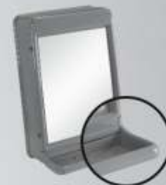
Armário c/ Porta Objetos 43 x 29 x 13cm