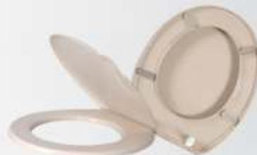
Assento Sanitário 45,5 x 37 x 30cm