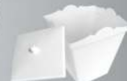
Lixeira Alemã 8 Litros