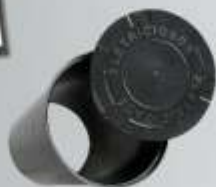
Caixa de Aterramento P (25 x 23cm) G (40 x 32cm)

1" 5 rolos de 1,7kg ½" 5 rolos de 2kg ¾" 5 rolos de 2kg 5/8" 5 rolos de 1,6kg