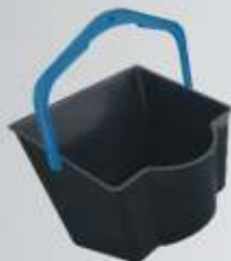
Balde de Pintura 6 Litros