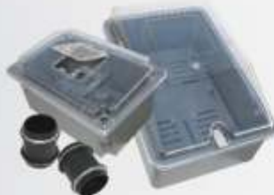
Kit Instalação Elétrica Caixa de Medição Trifásica 40 x 26 x 14 ou 20cm c/ tampa Caixa de Disjuntor 28 x 19 x 12 ou 15cm c/ tampa Nipel com Rosca 6 diâmetro x 8 altura