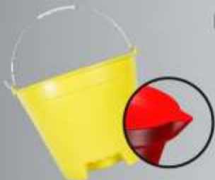
Balde 8 Litros 12 Litros Opção com Bico